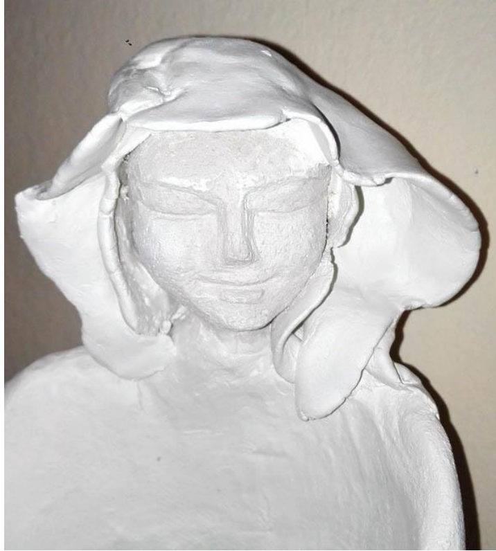
Tonfigur von Bahiravi, von Durga gemacht